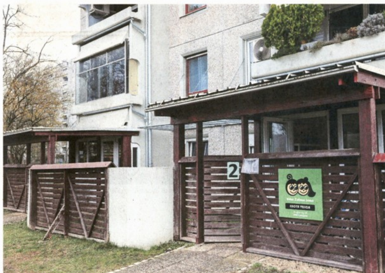
Ko bo dogradila enoto Vrba Vrta Zelena jama, bo ljubljanska občina tja preselila vrtčevsko enoto Vejica. Ta ima prostore v pritličju stanovanjskega bloka v Novih Fužinah.

Občina je lani jeseni pripravila statistiko o ljubljanskih vrtcih, iz katere je razvidno, da poleg enote Vejica še 14 vrtčevskih enot deluje v večstanovanjskih stavbah. »Po načrtu bomo te enote postopoma ukinjali, saj večinoma ne dosegajo prostorskih standardov niti nimajo lastnih igrišč,« so napovedali na občini. Približno polovica od 15 enot v blokih ne dosega normativov