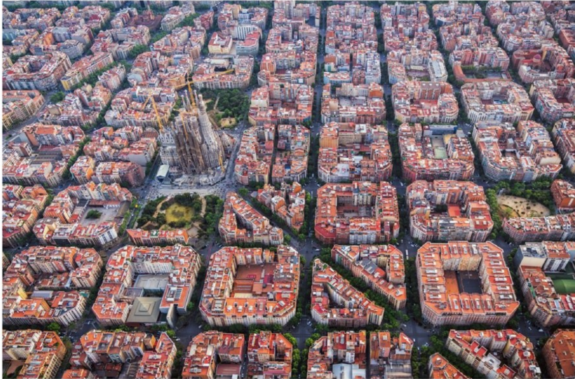
Barcelona | FOTO: Shutterstock

Implementacija ukrepov bo sicer odvisna od avtonomnih skupnosti. Do zdaj se je za omejevanje cen odločila le Katalonija, nekatere pa so že napovedale, da ukrepa ne bodo upoštevale. Nepremičninski sektor je medtem kritičen do uvedbe indeksa in opozarja, da bo zmanjšal ponudbo najemnih stanovanj .