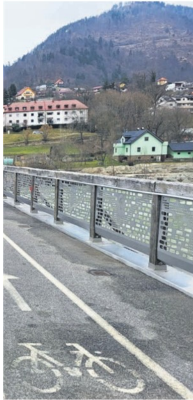
Dravograd si prizadeva biti mladim prijazna občina.

kov. Subvencijo ponujamo tako za gospodarstvo kot za mlade družine," je pojasnil župan.